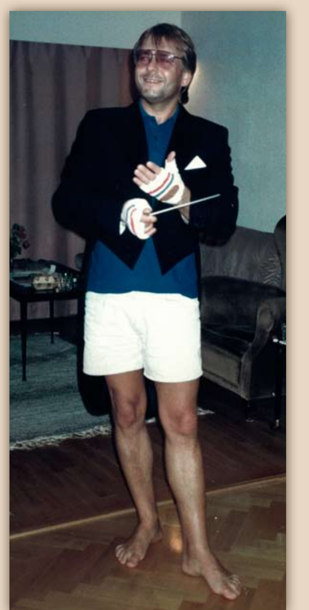
Peetri huumor on täiesti eriline, vaikne ja hästi tempereeritud...