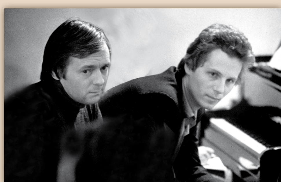
Peetri kodu ukсед olid alati sõpradele lahti. Pärast tema kontserte olid seal sageli külalised, aga tema pidi juba partituuri õppima. Ja siis ühendati meeldiv kasulikuga – pandi plaat peale või vaadati partituuri, lauldi ja arutati, kuidas seda teha.