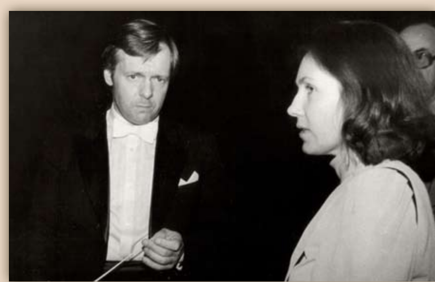
Ah, las need kriitikud kirjutavad – on ju Maia ...