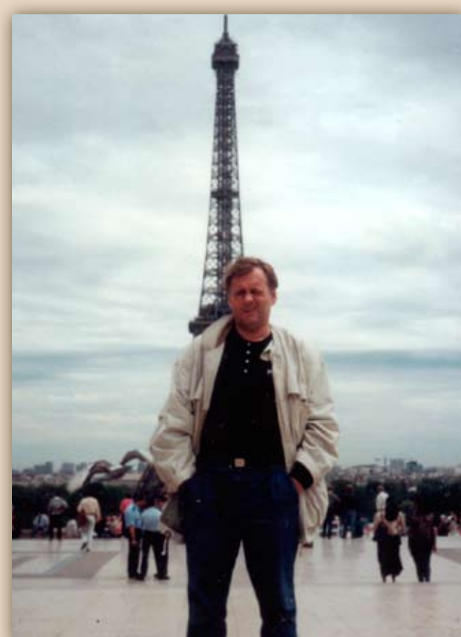
Pariisis: Peeter ...